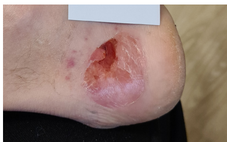
Tag 4 – Nach 2 CAP Behandlungen