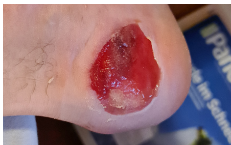
Tag 0 – Behandlungsbeginn

Bagatelltrauma - offen Blase am Fuß mit dauerhafter Belastung