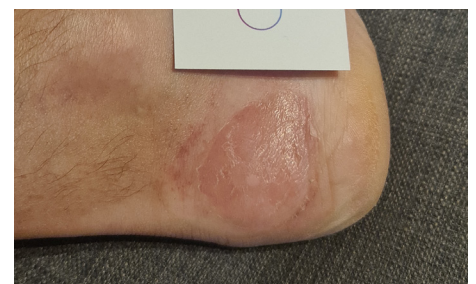
Tag 7 – Nach 3 CAP Behandlungen