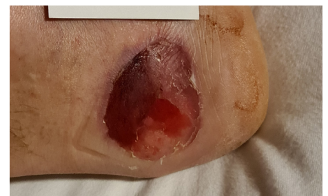
Tag 2 – Nach 1 CAP Behandlung